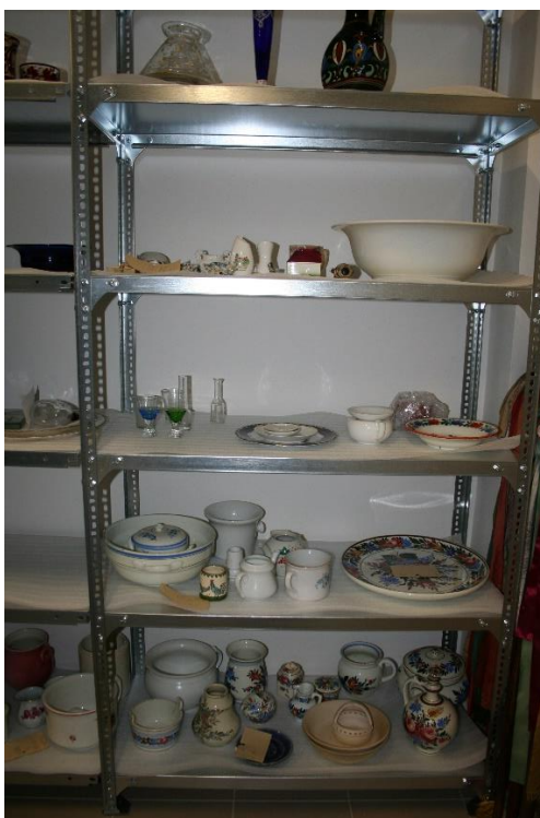
8. kép Mentésített szilikát alapú tárgyak a raktárban

A második ütemben 290db szilikát alapú műtárgy mentesítését végeztük el (8. kép).