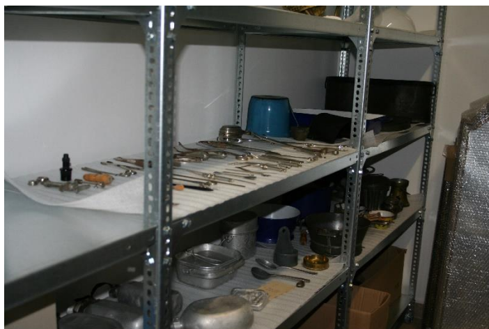
7. kép mentesített fém tárgyak

A második ütemben 290db szilikát alapú műtárgy mentesítését végeztük el (8. kép).