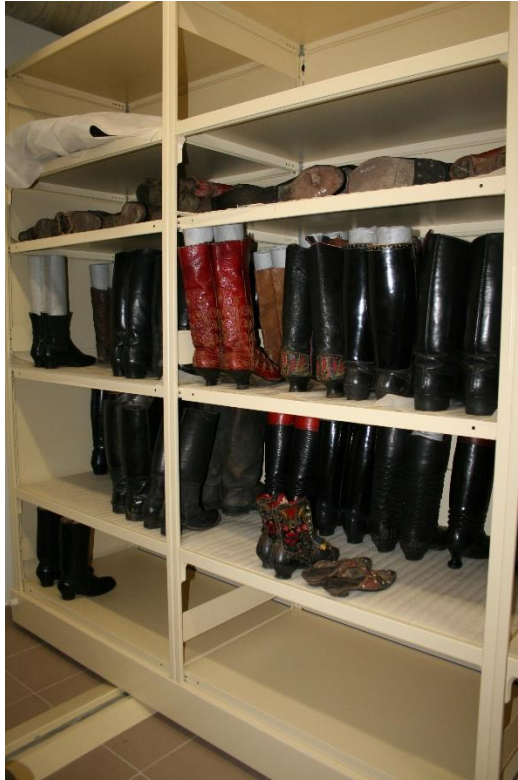
5. kép Mentésített lábbelik stabilizálása és elhelyezése raktárban

A fémtárgyak mechanikus tisztítással való mentésítését, a pályázatból vásárolt polírozó gép segítségével tudtuk elkezdni (6. kép). 230db már raktárba került (7. kép).