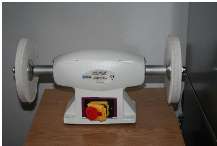
6. kép Polírozó gép

A fémtárgyak mechanikus tisztítással való mentésítését, a pályázatból vásárolt polírozó gép segítségével tudtuk elkezdni (6. kép). 230db már raktárba került (7. kép).