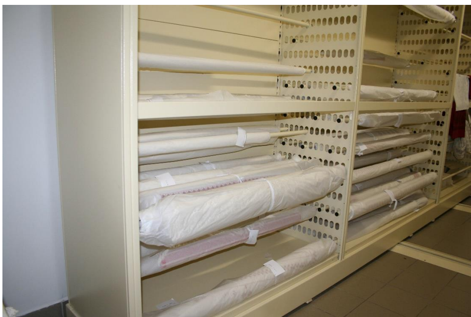
4. kép Hengerelt mentésített síktextilek

A néprajzi gyűjtemény viseletdarabjait alkotó bőr lábbelik a hosszú távú tárolás során károsodhatnak. Ezek esetében (leginkább a csizmaszáraknál), a mentésítés elvégzése után, savmentes papírral bevont Polifoam csőhéjas kitámasztást alkalmaztunk. Így a szakszerű tárolással megakadályozhatjuk a további sérüléseket. 74 pár bőr lábbeli mentésítése és megfelelő körülmények között való elhelyezése befejeződött (5. kép).