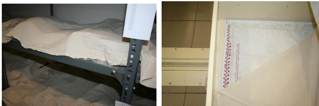
2-3.kép Mentésített műtárgy porvédelme molinóval