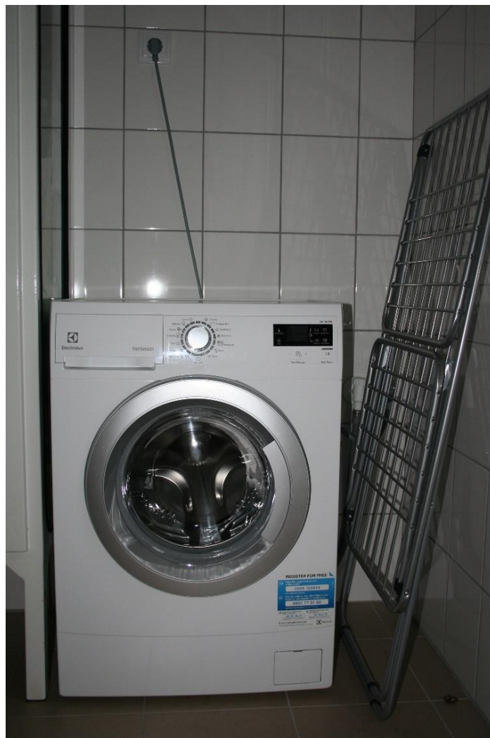
1. kép Mosógép és szárító

A megtisztított textilek korszerű tárolása érdekében szükség volt természetes alapanyagú (molinó) védőtakarók beszerzése. A megvalósításhoz nagy mennyiségű méterárura volt szükség, amelyet a gyártása során kezelőanyaggal itatnak át. Állományvédelmi szempontból ennek eltávolítása szükséges, így indokolt volt mosógép és szárító vásárlása a restaurátor műhely számára (1. kép).