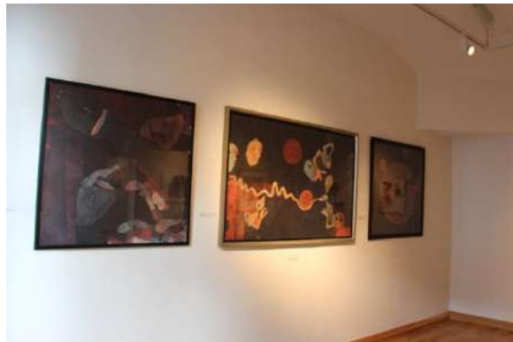
Fotók a Radnóti pályázatról – Zsinagóga Galéria